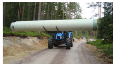
Skånsom løfting av rør