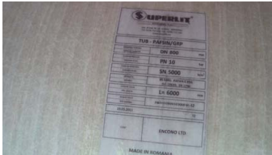
Identifikasjonsslipp på hvert rør