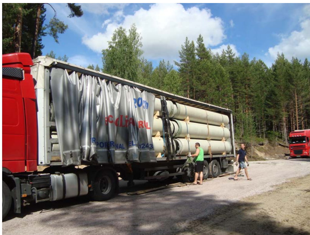
Solid transportsikring bidrar til feilfri leveranse