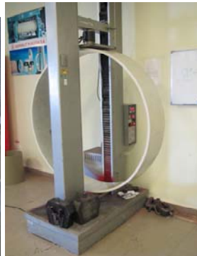
Test av ringstivhet